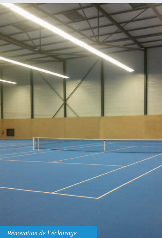
Rénovation de l'éclairage